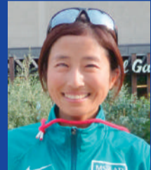
みちた みさと 道下 美里

1977年1月19日生 山口県下関市出身 現在、三井住友海上火災保険(株)所属 2004年盲学校在学中に陸上競技と出会い、2008年からフルマラソンに挑戦する。144cmと小柄だが、「あきらめない心」「挑戦する心」で、次々と各地の大会へ出場。2016年に出場したリオデジャネイロパラリンピック視覚障がい者女子マラソンで見事銀メダルを獲得。 2017年防府読売マラソンで世界新記録を樹立した。 主な戦績は以下のとおり。 2016年 リオデジャネイロパラリンピック 銀メダル 2017年 ロンドンマラソン兼2017 World Para Athleticsマラソンワールドカップ 優勝 2017年 防府読売マラソン 優勝(2時間56分14秒)※世界新記録 2018年 ロンドンマラソン兼2018 World Para Athleticsマラソンワールドカップ 優勝 2018年 防府読売マラソン 優勝 2018年 別府大分毎日マラソン 優勝 2019年 ロンドンマラソン兼2019 World Para Athleticsマラソンワールドカップ 優勝