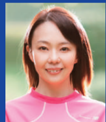
ちば まきこ 千葉 真子

1977年1月19日生 山口県下関市出身 現在、三井住友海上火災保険(株)所属 2004年盲学校在学中に陸上競技と出会い、2008年からフルマラソンに挑戦する。144cmと小柄だが、「あきらめない心」「挑戦する心」で、次々と各地の大会へ出場。2016年に出場したリオデジャネイロパラリンピック視覚障がい者女子マラソンで見事銀メダルを獲得。 2017年防府読売マラソンで世界新記録を樹立した。 主な戦績は以下のとおり。 2016年 リオデジャネイロパラリンピック 銀メダル 2017年 ロンドンマラソン兼2017 World Para Athleticsマラソンワールドカップ 優勝 2017年 防府読売マラソン 優勝(2時間56分14秒)※世界新記録 2018年 ロンドンマラソン兼2018 World Para Athleticsマラソンワールドカップ 優勝 2018年 防府読売マラソン 優勝 2018年 別府大分毎日マラソン 優勝 2019年 ロンドンマラソン兼2019 World Para Athleticsマラソンワールドカップ 優勝