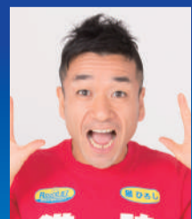
ねこ ひろし 猫 ひろし

1976年7月18日 京都府宇治市出身 立命館宇治高等学校→旭化成→豊田自動織機 1996年 アトランタオリンピック 女子10000m 5位 1997年 世界陸上アテネ大会 女子10000m 3位(銅メダル) 2003年 世界陸上パリ大会 女子マラソン 3位(銅メダル) 2004年・2005年 北海道マラソン 優勝 現在は「スポーツで世の中を元気にしたい」という目標を掲げ、ゲストランナーとしてマラソン大会に出演する他、講演会やメディアなどで活動している。 また、2010年に「千葉真子BESTSMILEランニングクラブ」を立ち上げ、市民ランナーの指導や普及活動も積極的に行っている。