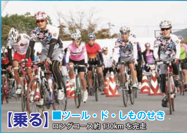
【乗る】■ツール・ド・しものせき ロングコース約 130km を完走