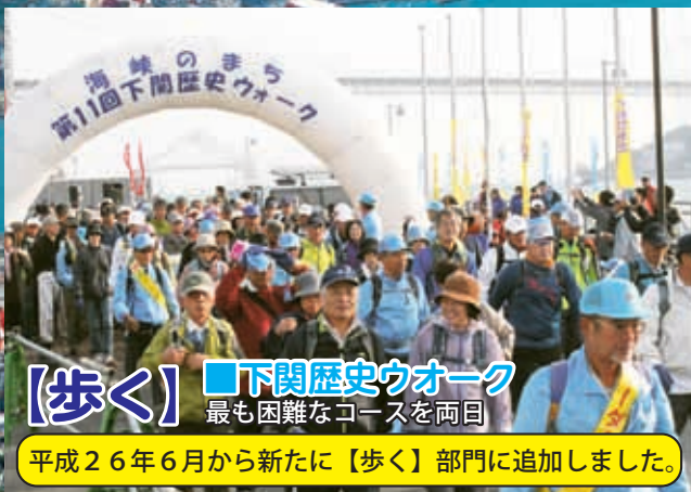
【歩く】■下関歴史ウォーク 最も困難なコースを両回