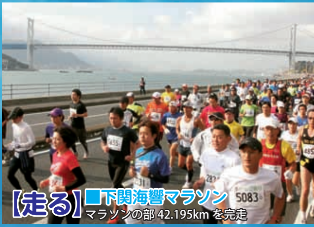
【走る】■下関海響マラソン マラソンの部 42.195km を完走

認定は平成二十四年十月からの大会が対象です。 注：開始日以前に開催された大会は対象となりません。